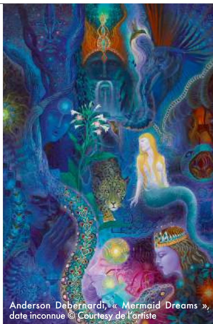
Anderson Debernardi, « Mermaid Dreams », date inconnue © Courtesy de l'artiste

Jusqu'au 26 mai. Musée du Quai Branly-Jacques Chirac. 37, quai Branly, Paris (7 e ). quaibranly.fr