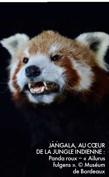
JĀŅGALA, AU CŒUR DE LA JUNGLE INDIENNE : Panda roux – « Ailurus fulgens ».

Jusqu'au 28 avril. Muséum de Bordeaux – sciences et nature. 5, place Bardineau, Bordeaux (33). museum-bordeaux.fr